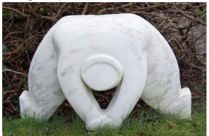
Zwaargewicht / Carrara marmmer