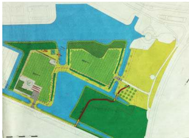
Het plan "schooltuintjes"

de Kalfjeslaan. Bomen worden gekapt en de vrachtwagens hebben nu alle ruimte voor zich alleen. Volgend jaar zal het er hier allemaal heel anders uitzien.