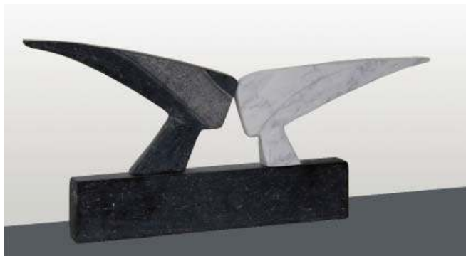
Silhouetten / Belgisch hardsteen / Carrara marmmer

Ze werkt met diverse steensoorten, maar Belgisch hardsteen heeft haar voorkeur, vanwege de zwarte kleur en de afwezigheid van lagen en richtingen die breken in de hand werken. Veel materiaal komt van sloopwerk, b.v. hardstenen stoep treden die worden vervangen door beton.