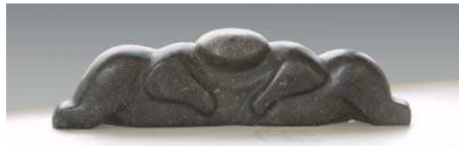
Sumo / Belgisch hardsteen

Haar werkplaats is een overdekt gedeelte voor het huis. Zo werkt ze lekker in de open lucht en heeft weinig last van steenstof. Het beeld waar ze nu mee bezig is, is een opdracht voor een huis-