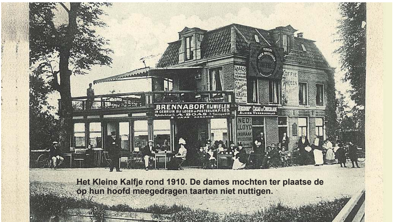
Het Kleine Kalfje rond 1910. De dames mochten ter plaatse de op hun hoofd meedragen taarten niet nuttigen.