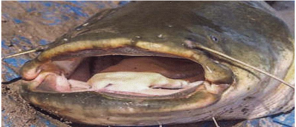
Kop van een meerval (en dan is dit nog het kleine broertje)