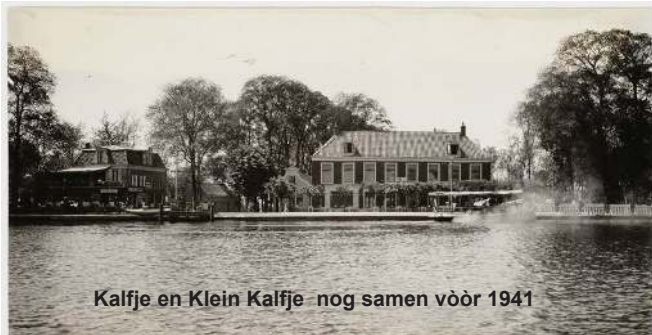
Kalfje en Klein Kalfje nog samen vóór 1941