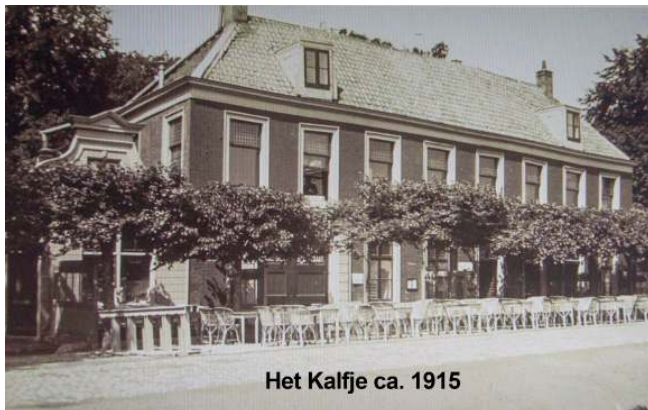
Het Kalfje ca. 1915